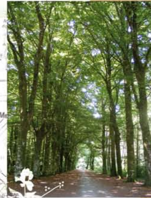
Entrée du bois de Kerozer